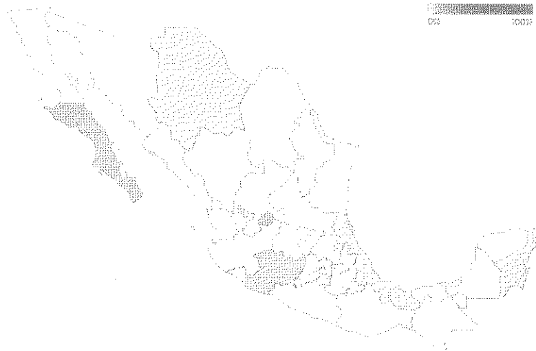
Sistema 6 PDN - Interconexión

En la integración de sujetos obligados por entidad a la PDN